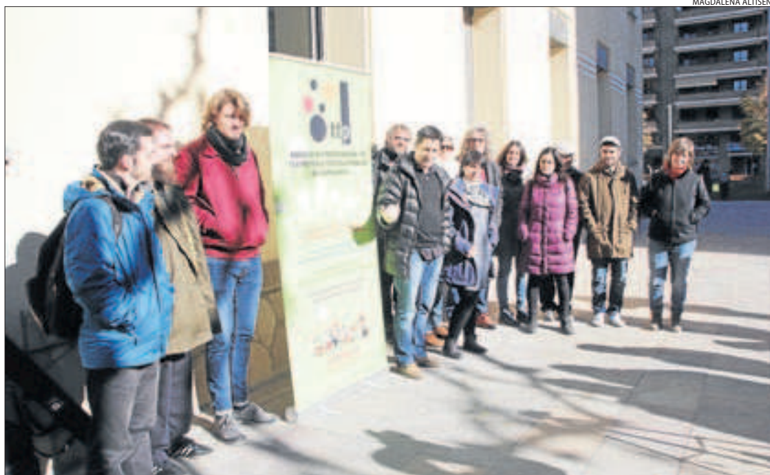
Les companyies lleidatanes de teatre familiar van presentar ahir les propostes davant de l'Escorxador.

Diversos responsables i representants de les companyies Xip Xap, Festuc Teatre, Campi Qui Puguí, La Baldufa, Centre de Titelles de Lleida, Zum Zum Teatre, JAM, Encara Farem Salat i Íntims Produccions reclamen, per la seua part, un canvi de model teatral a Lleida que arrancaria per l'elaboració des de l'Escorxador d'una cartellera única de la ciutat, tant en